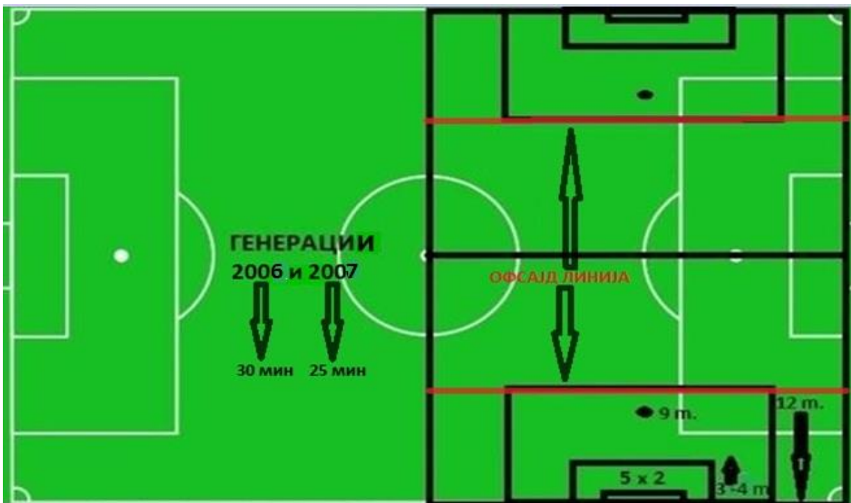
8x8 2x30/25 min. Dim.-65(min.) x 50(min.) Pen.-9m. Sesnaesetnik - 12m. Peterec - 3-4 m.