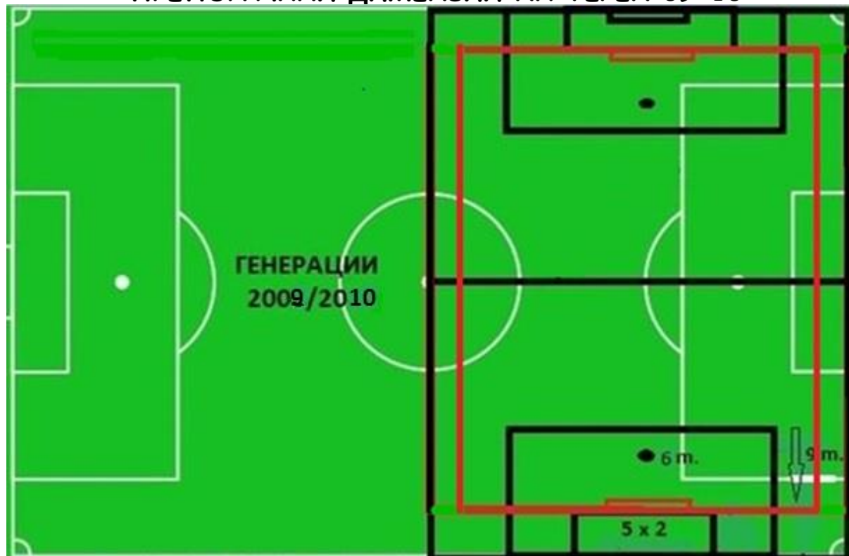
5x5 2x20min. Dim.38(min.)x16(min.) Pen.-6m. Sesnaesetnik - 9m. Peterec -